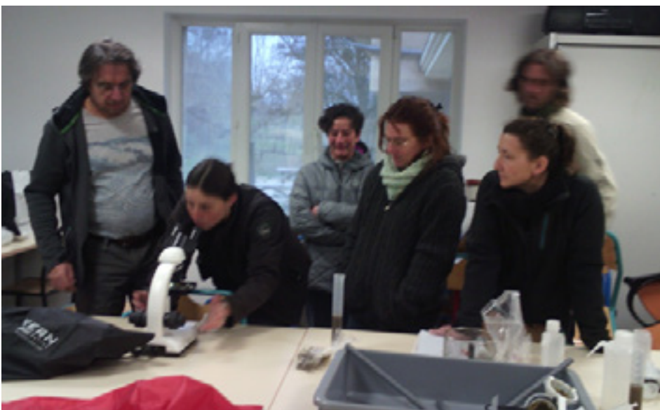
Etude au microscope de coprologie lors d'une journée échange phyto-aroma

Si tout cela vous intéresse, des comptes-rendus de ces journées sont disponibles sur demande.